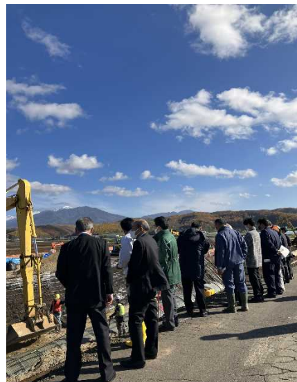
(R4 特別委員会現地視察)