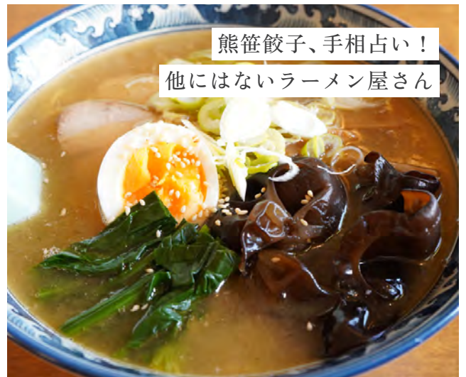
熊笹餃子、手相占い！ 他にはないラーメン屋さん

豚、鶏、椎茸の出汁を使ったスープは、あっさりし細麺によく絡み美味しい。人気メニューは「塩ラーメン」で、定番メニューの他には「とんこつラーメン」「チャーシューラーメン」「五目ラーメン」があり、豊富な種類。時期によっては、アスパラガスのトッピングなど、近郊の野菜を使っている。きっと初めて食べる人も多い「熊笹餃子」は、熊笹の香りがして香ばしい味。