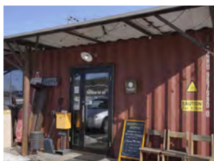
ナカフの素材を 楽しめるクラフトビール

2024年の国内ビール品評会ではなんと「銀賞」を受賞。「中富良野町のクラフトビールを作りたい」「夏以外の観光を盛り上げたい」など、沢山の想いをビールに込めている。メニューには、ラベンダーや酒粕などその素材の味を活かした5種のビールをご用意。Nostalgiaは、ラベンダーとレモンの香りを楽しめる。店内はTaproomとなっており、おつまみとビールを楽しむ。