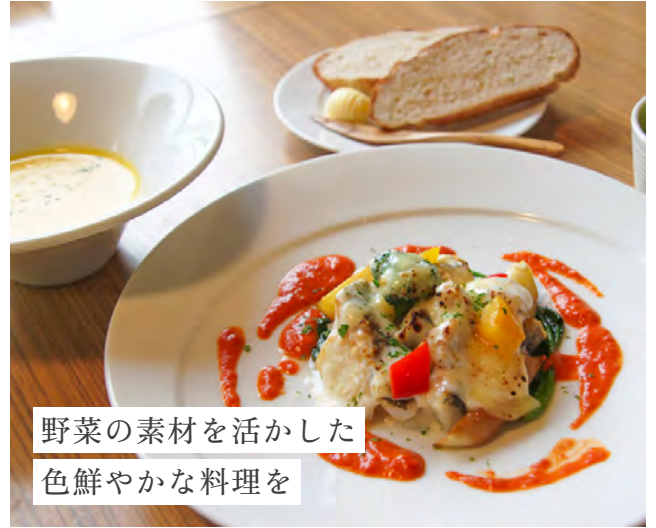
野菜の素材を活かした 色鮮やかな料理を

「本日のセット」は、お魚かお肉のメインを選び、スープ、サラダ、自家製全粒粉のパンかライス付き。できる限り旬の近郊の野菜を使っている。そのためカボチャ、アスパラ、トマトのスープが登場するなどセットの内容は変わる。バーニャカウダ(期間限定)は丸いお皿に色鮮やかな野菜が飾られ、まるで1枚の絵を見ているよう。