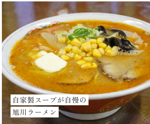
自家製スープが自慢の 旭川ラーメン

旭川ラーメンの定番は「醤油ラーメン」だが、お店の方のおすすめは「味噌ラーメン」。コクのある味噌スープが、具材や麺によく絡む。バターとコーンをのせれば、まろやかに二度美味しい。「ピリ辛味噌ラーメン」も試してみたい。お客さんの好みに合わせ、麺の硬さや、スープの濃さを調整してくれるのが嬉しい。