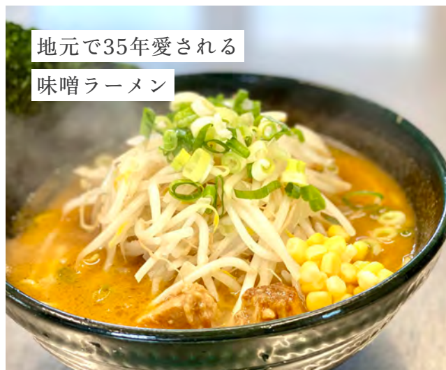
地元で35年愛される 味噌ラーメン

人気メニューは「味噌ラーメン」だが、他にも「ピリ味噌」「黒味噌」「白味噌」など様々な味噌ラーメンがある。お好みで全てのラーメンにニンニクを入れることが可能。