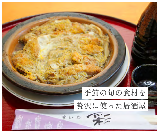
季節の旬の食材を 贅沢に使った居酒屋