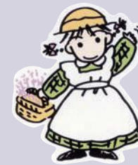
中富良野町 イメージキャラクター ラベンダーの妖精