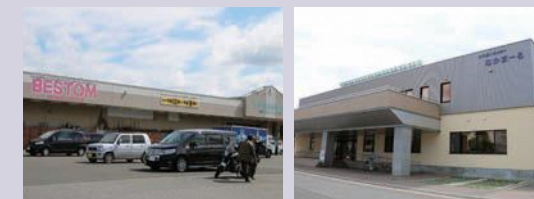
▲ スーパーセンター ベストム